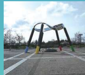
松任総合運動公園