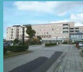
松任石川中央病院